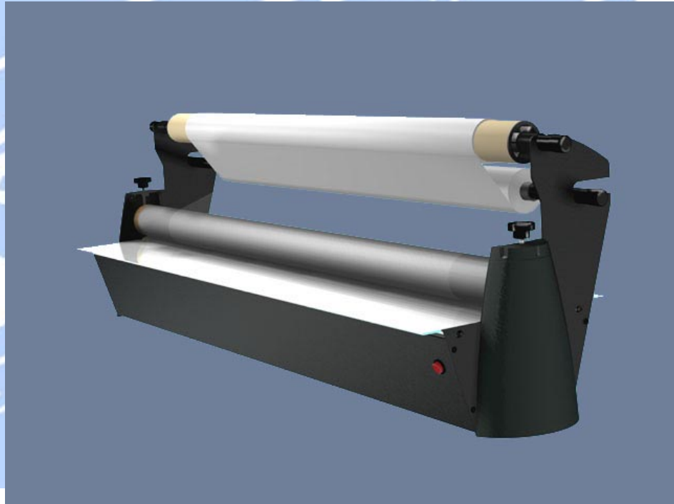
Abbildung zeigt den QUICKMOUNT III mit integriertem Rollenhalter

Mit dem Quickmount III Rollenlaminator entfällt der Aufwand und die Kosten des Outsourcings. Sie können viel schneller und einfacher reagieren, damit Sie Ihren Kunden bestmögliche Qualität liefern können.